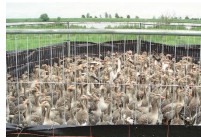
Wij kijken dus eerst waar we die kraal

Daarna drijven we de ganzen naar een groot hok in een aanhanger waarin we de flessen CO2 hebben. Als ze daarin zitten, sluiten we die kist en laten het gas erin lopen. De hoeveelheid CO2 laten we langzaam oplopen. Als na ongeveer 40 seconden het CO2-gehalte 30 à 40% is, raken de vogels bedwelmd. Dan verhogen we het CO2-gehalte naar 70%. Na 56 seconden zijn ze hersendood. Binnen de twee minuten zijn ze dood. Onderzoek door Wageningen Universiteit heeft aangetoond dat het hart na ongeveer anderhalf à twee minuten geen reactie meer geeft. Europese voorschriften zeggen dat we voor alle zekerheid dan nog vijf minuten moeten doorgaan. De Raad voor Dierenaangelegenheden heeft deze methode dan ook diervriendelijk genoemd.'